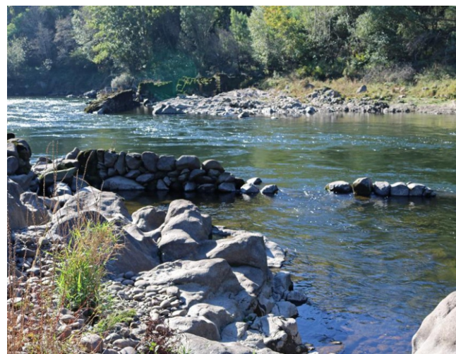
Restos de antigas pesqueiras